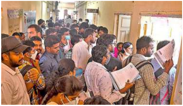
The PLFS revealed that the unemployment rate in urban areas dipped for the fourth straight quarter to 7.6% during April to June 2022

Rural vs urban Urban unemployment rate jumped to 9.57 per cent in August as against 8.21 per cent in July. Rural joblessness also increased but remained lower