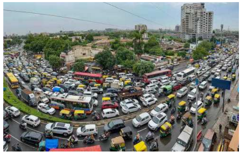
Traffic came to a standstill in Ahmedabad, on Thursday as heavy rains lashed Gujarat with more showers predicted over the next couple of days. The western State has received over 40 per cent excess rainfall this monsoon, despite the annual event setting in late