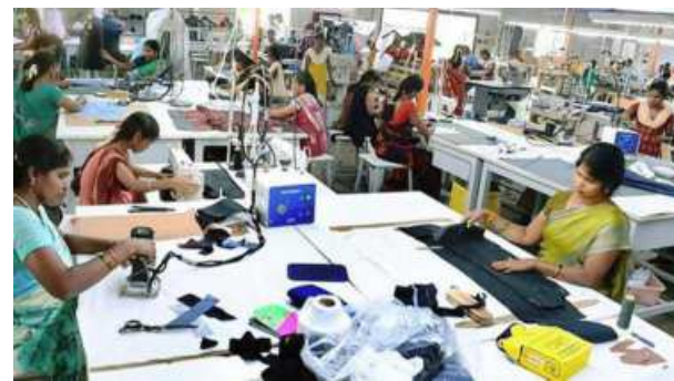
The Quality Control Order will not apply to VSF meant for export, which conform to the specification required by the foreign buyer

The government's attempt to check the quality of imported VSF (by drafting a QCO) comes just a year after anti-dumping duties on import of VSF from China and Indonesia were revoked to make the domestic user industry, including manufacturers of garments and yarn, more competitive. Domestic production of VSF is mostly done